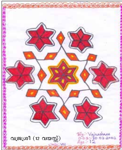
വജ്രശ്രീ (12 വയസ്സ്)