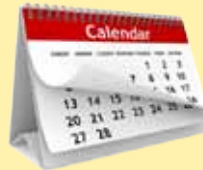
സന്ദർശന ദിവസം തിരഞ്ഞെടുക്കുക