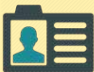
നിങ്ങളുടെ വ്യക്തിഗത വിവരങ്ങൾ നൽകുക