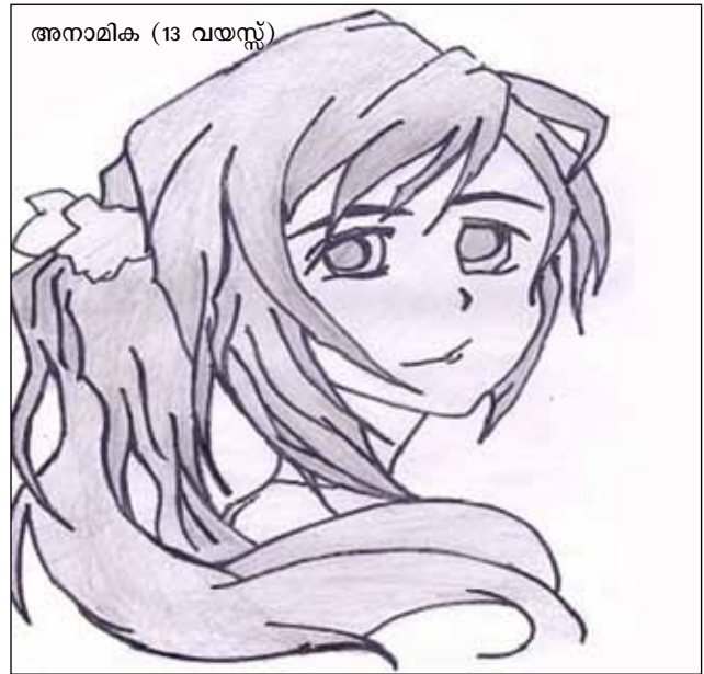
അനാമിക (13 വയസ്സ്)